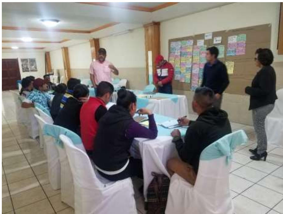
Taller 3. 4 de julio de 2019