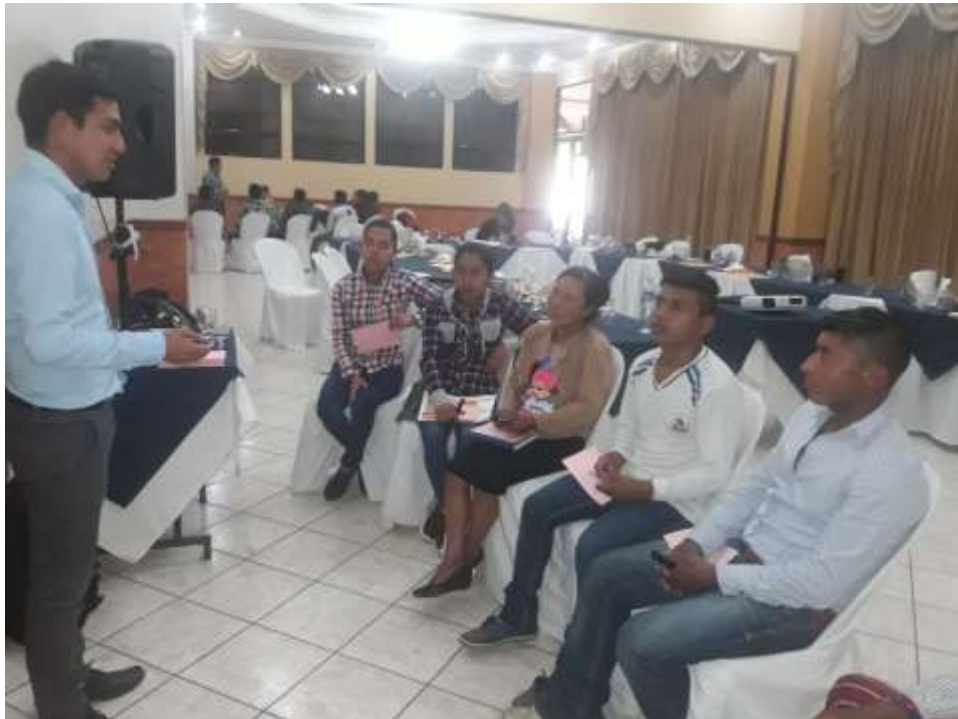
Taller 1. 10 de mayo de 2019