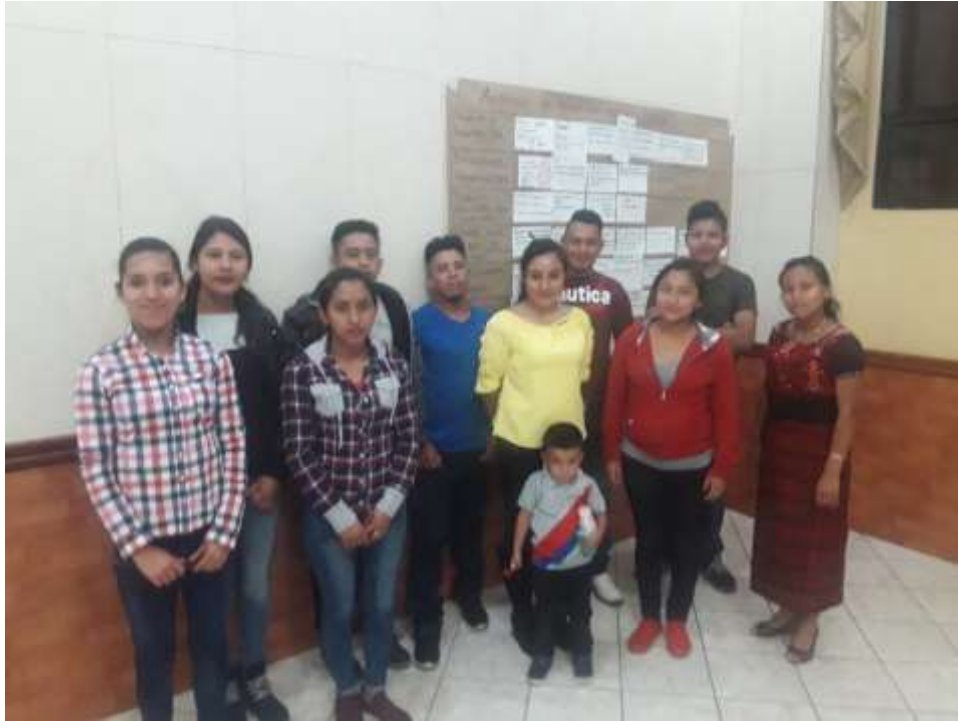
Taller 1. 10 de mayo de 2019