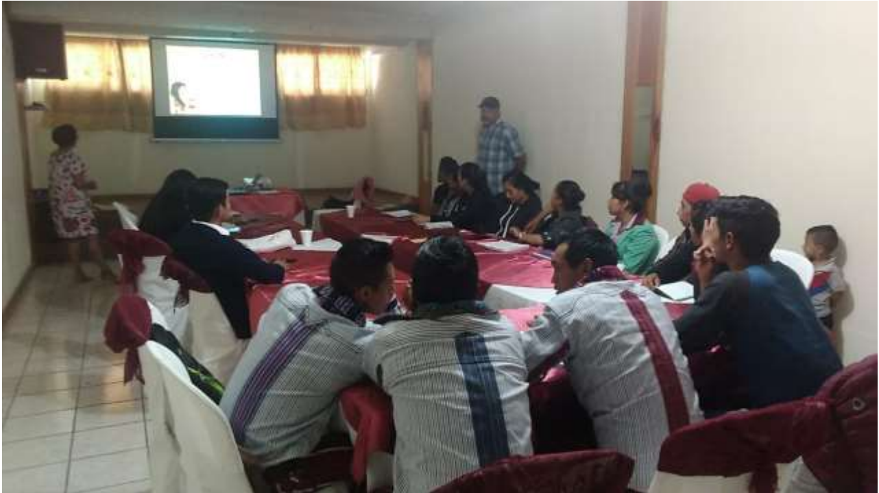
Taller 2. 6 de junio de 2019